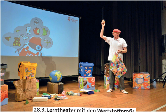
28.3. Lerntheater mit den Wertstoffprofis

11.00 – Französischer Markt. Käse und Wurst aus der Auvergne und dem Baskenland, Nougat aus Montélimar, schmackhafte Oliven und Trockenfrüchte, Salamispezialitäten, französische Brot- und Backwaren oder feine Speiseöle. Nicht fehlen dürfen natürlich erlesene französische Weine, die sich zu den frisch zubereiteten Flammkuchen oder Galettes genießen lassen. Vielleicht bringen unsere Freunde aus Frankreich sogar einen „Chanteur“ mit, auf jeden Fall aber etwas Sonne und natürlich jede Menge französisches Lebensgefühl. Marktplatz, Ende offen