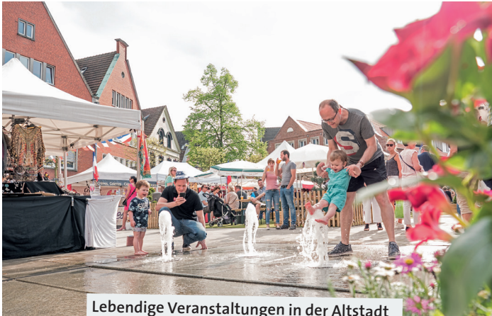
Lebendige Veranstaltungen in der Altstadt folgen dem Cittaslow-Gedanken.