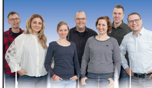
IHR RADIO KIEPENKERL-TEAM

NACHRICHTEN FÜR DEN KREIS COESFELD UND DAS MÜNSTERLAND (6.30 - 19.30 Uhr)