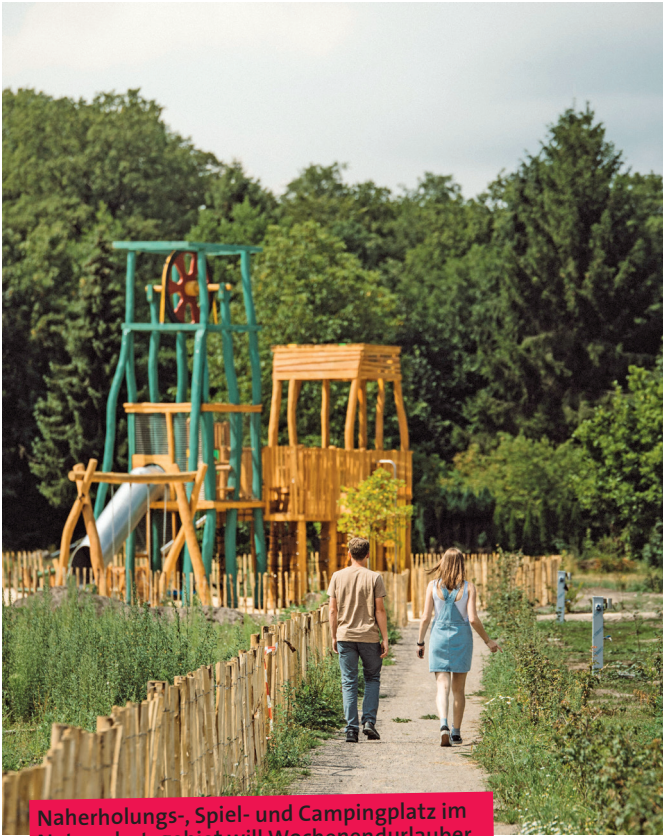
Naherholungs-, Spiel- und Campingplatz im Naturschutzgebiet will Wochenendurlauber anziehen – gern mit Kindern.