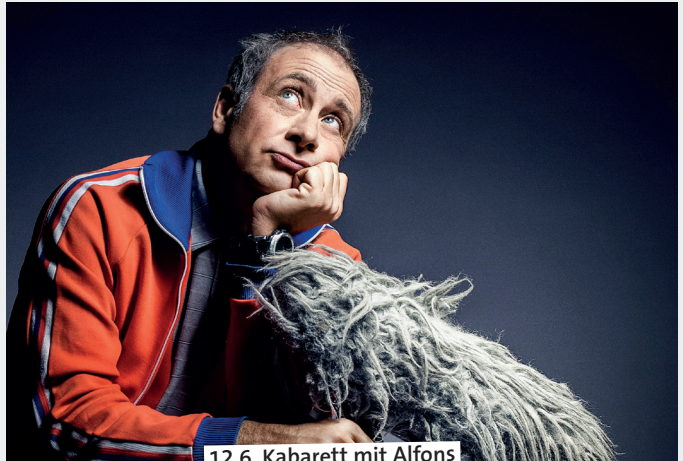
12.6. Kabarett mit Alfons

20.00 – Kabarett: Alfons Le Best of. Aula der Realschule, Eintritt: 24 Euro. Veranstalter: Freunde der Kleinkunst; Karten bei LH Marketing oder über www.freunde-der-kleinkunst.de