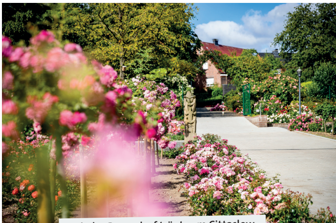
Auch das Rosendorf trägt zum Cittaslow-Potenzial von Lüdinghausen bei.