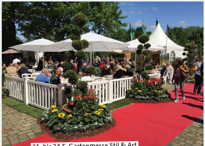
21. bis 24.5. Gartenmesse Stil & Art

12.00 – Lüdinghausen karibisch. Der Marktplatz verwandelt sich in eine traumhafte Urlaubslandschaft mit Palmen, feinstem Sand, Beachvolleyball etc. Das Ganze gepaart mit Cocktails, Gauzenfreuden und einer Menge an Live-Musik