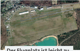
Der Flugplatz ist leicht zu erreichen und bietet ausreichend Parkplätze.

Die Borkenberge Gesellschaft e.V. betreibt den Flugplatz / viel ehrenamtliches Engagement gefordert