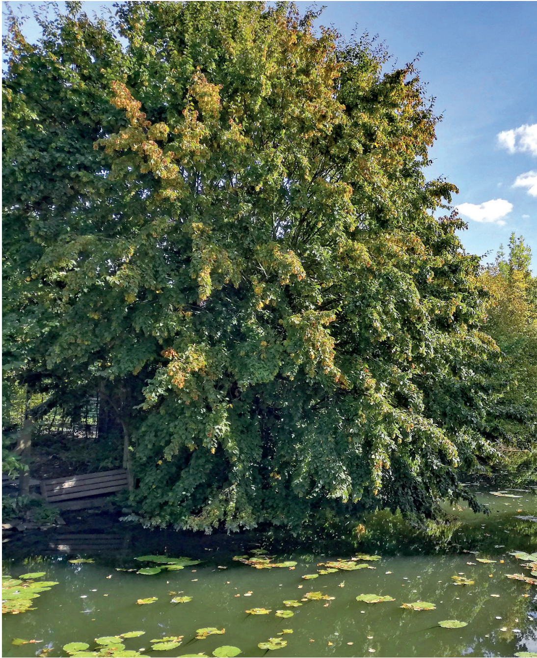
Schön grün und idyllisch: Der Blick vom Steverwall aus Richtung Felizitaskirche.