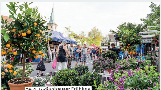
26.4. Lüdinghauser Frühling

19.30 – Frühlingskonzert. Musica Camerata. Mit Werken von Richard Wagner, Max Bruch und