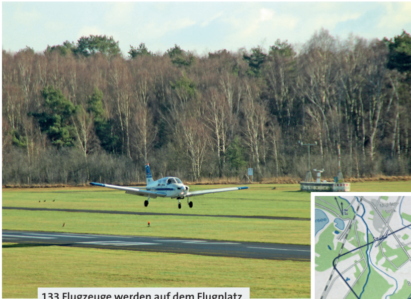
133 Flugzeuge werden auf dem Flugplatz von ca. 400 Mitgliedern bewegt.