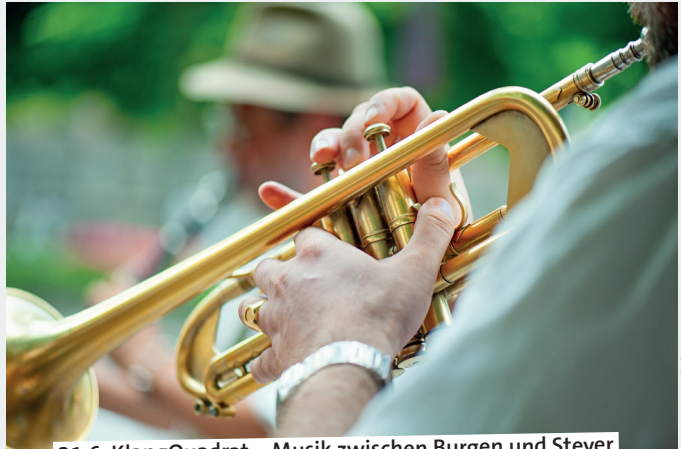
21.6. KlangQuadrat – Musik zwischen Burgen und Stever

11.00 – Schlösser- und Burgen-tag. Burg Vischering und Burg Lüdinghausen