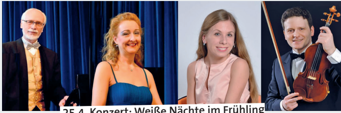
25.4. Konzert: Weiße Nächte im Frühling

Joseph Haydn, Kapitelsaal, Burg Lüdinghausen; Vorverkauf bei Lüdinghausen Marketing